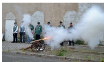
Auch in dieses Jahr wurden die Schützenkönige mit drei lauten Kanonenschüssen geehrt.

Auch wenn die Feier durch die Covid-19 Auflagen ein wenig eingeschränkt war, wurden beide Titelträger gebührend geehrt. Gleichzeitig zeigt das junge Gesamalter beider Schützen, dass der Röthaer Schützenverein auch im Nachwuchsbereich bestens aufgestellt ist und dass auch junge Schützen die Möglichkeit haben, sich gegen die Erfahrenen, älteren Schützen durchzusetzen. In dem Sinne: herzlichen Glückwunsch!